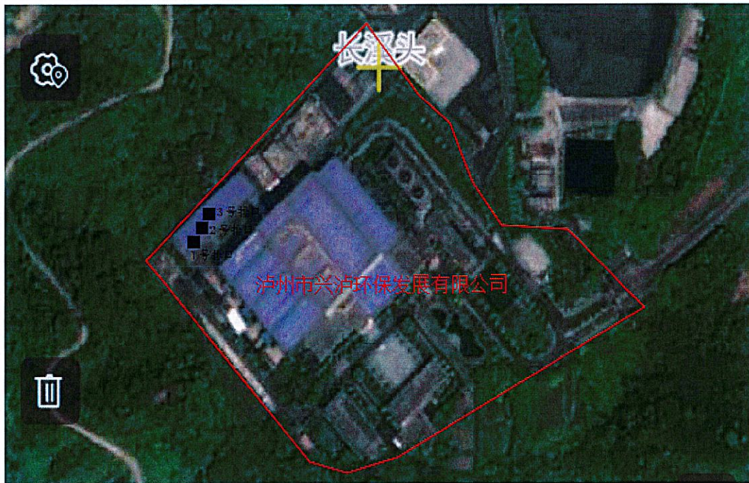
图例：■ 固体废物采样点