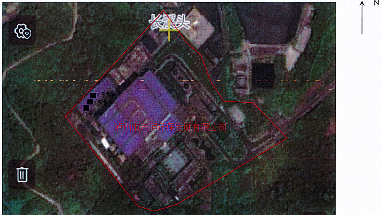
图例：■ 固体废物采样点