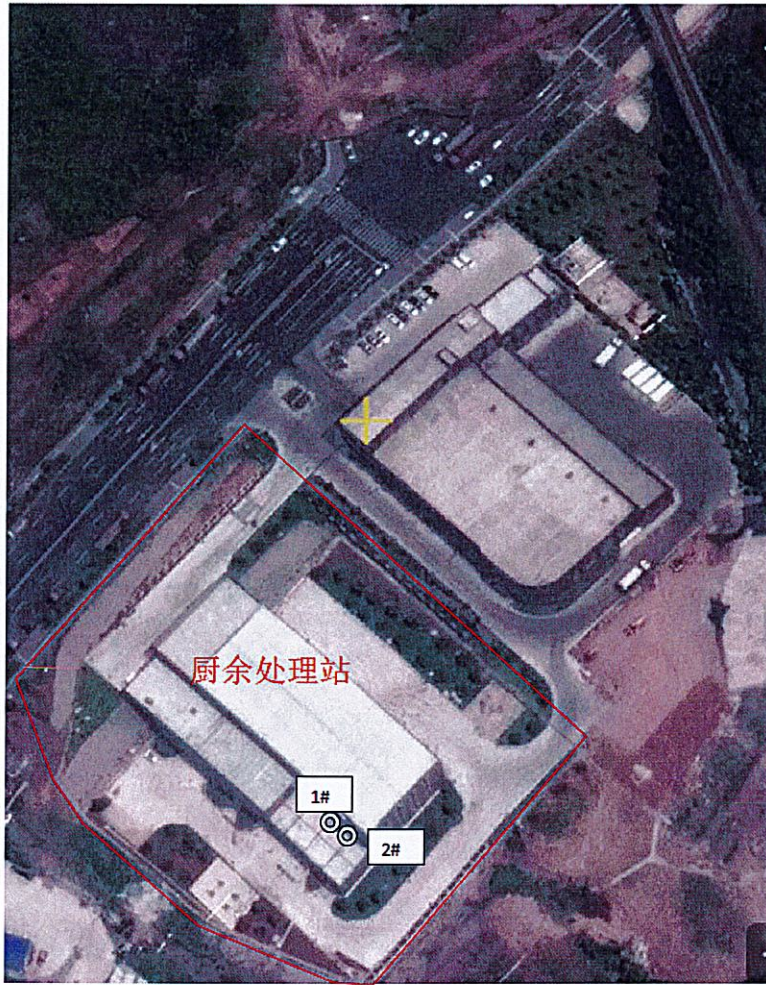
图例: ⊙ 表示有组织废气采样点