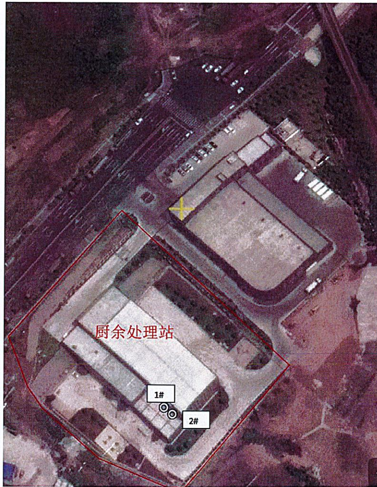
图例: ◎ 表示有组织废气采样点