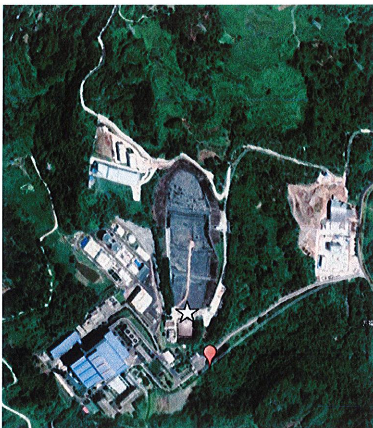
图例：☆ 地下水采样点